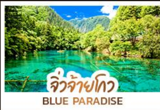
จิวจ้ายโกว BLUE PARADISE