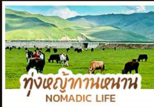
ทุ่งหญ้ากานหนาน NOMADIC LIFE