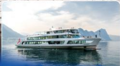
ล่องเรือทานอาหารกลางวัน ทะเลสาบลูเซิร์น