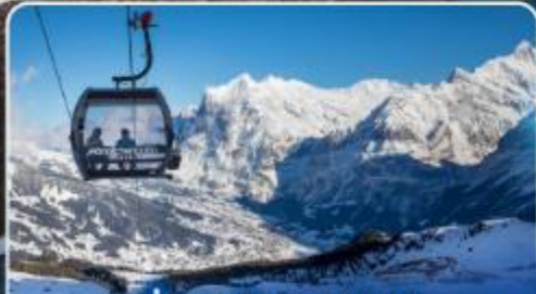
นั่งกระเช้าและรถไฟสู่ ยอดเขาจุงเฟรา