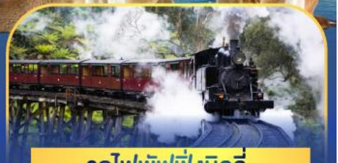
รถไฟพuffingบิลลี่

ล่องเรือชมอ่าวซิดนีย์พร้อมรับประทานอาหารกลางวัน และ เข้าชมสวนสัตว์การองก้า