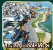
ทะเลสาบเอ๋อไห่คัง S