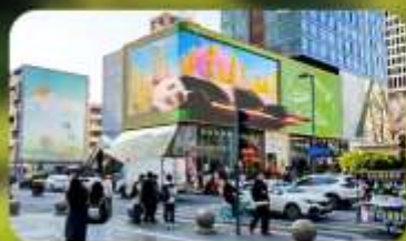
ไท่กุ่หลี่