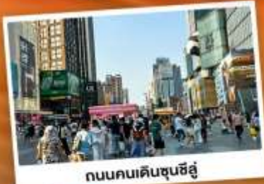
ถนนคนเดินชุนชิว