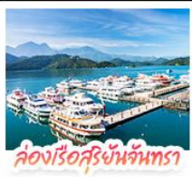
ล่องเรือสุริยจันทร์

ล่องเรือชมทะเลสาบสุริยจันทร์ (SUN MOON LAKE) ชมทะเลสาอู วนะ-วัดสวทง • อีสระเคินเล่น หนูนาน้อต้าซ่า • นังรถไฟเล็กโบราณ (1 สามี) สิมี่สบรรยากาศเส้นทางรถไฟสายธรรมชาติ • ตะลุย ไทจงไม้บาร์เท็ด แหล่งรวมแฟชั่นและสตรีทฟู้ด • ซ้อบิ่งย่าน ซี้เหมินตัง (XIMENDING) ถ่ายรูปแลนด์มาร์ค ดึกไทเป 101 • ซ้อบิ่งกึ่งทวงที่ MITSUI OUTLET PARK ชมความสวยงามของ อนุสรณ์สถานเจียงไทเซก • ขอพรความรักที่ วัดหลงชาน ชมโศกหิมเศียรราชินีที่ เย่หลิว • ชมบรรยากาศเมืองเก่าที่ จิวเฟิ่น