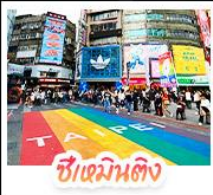
ซีเหมินตัง