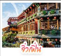
จิวเฟิ่น