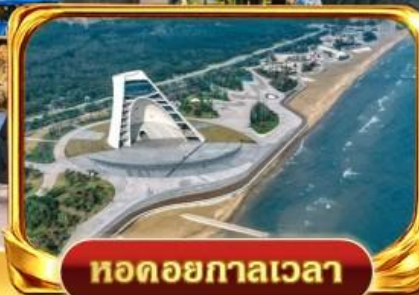
หาดอวยกาลเวลา