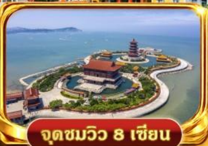
จุดชมวิว 8 เซียน