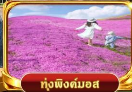
ทุ่งพิงค์มอส