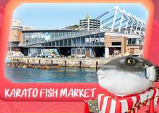
KARATO FISH MARKET

vietjetair.com สายการบิน Vietjet Air (VZ) น้ำหนักกระเป๋า 20 KG