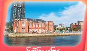
โมจิโกะ เรโทร