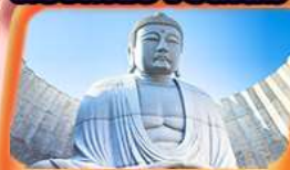
เดินชมพระพุทธรเจ้า