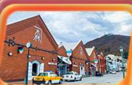
โกดังอิฐแดง

สายการบิน Thai Airways (TG) น้ำหนักกระเป๋า 23 KG