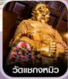
วัดเขกทมิว

✈️ คอนเฟิร์มออกเดินทาง ✈️ ทุกพีเรียด 2 ท่านขึ้นไป