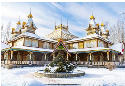
LITTLE RUSSIA (VOLGA MANOR)

เช้า รับประทานอาหารเช้า ณ ห้องอาหารของโรงแรม (11)