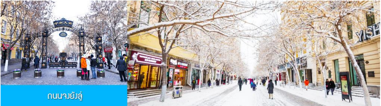
ถนนจงย้ง

เที่ยง รับประทานอาหารกลางวัน ณ ภัตตาคาร (2) หลังอาหารนำท่านชม อนุสาวรีย์ฝังหง 防洪纪念碑 อนุสรณ์ของชาวเมืองฮาร์บินที่ถูกจารึกในประวัติศาสตร์ในการเอาชนะอุทกภัยธรรมชาติครั้งใหญ่ในปี ค.ศ. 1957