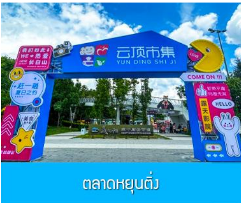
ตลาดหยุนต้ง