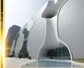
โรงละครโดง