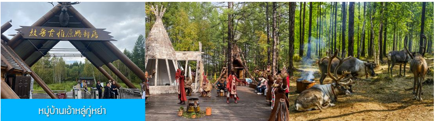
หมู่บ้านเอ้อเอ่อกู่หย่า