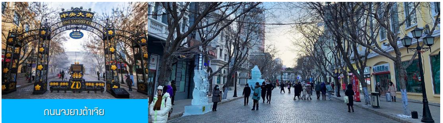
ถนนจงยางต้าเจีย