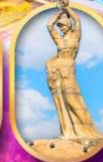
เด็กหญิงชาวประมง