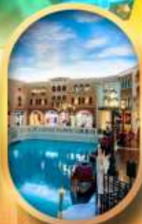
เดอะเวนิเซียน