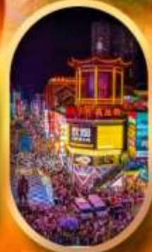
ถนนคนเดินซิงลู่