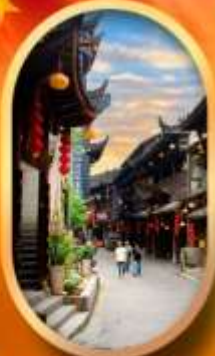
เมืองโบราณฟูหลงเจี้ยน