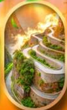
หุบเขาป้ายจ้าง