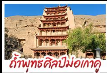
กำแพงพุทธรศิลป์ม่อเกาดู

เป็นทรายครวญ - สระน้ำงพระจันทร์ ทะเลสาบเกลือฉ่าซ่า - กำพุทธรศิลป์ม่อเกาดู หุบเขาสายรุ้งจางเย่ - ทะเลสาบซิงไห่