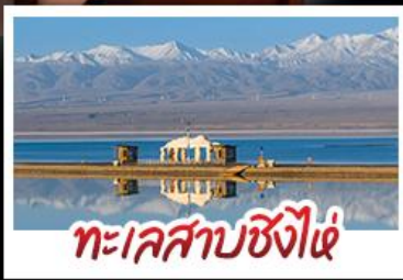
ทะเลสาบซิงไห่