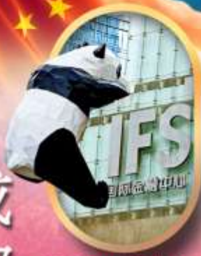
IFS หมีแพนด้าป็นดัก