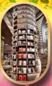
อุทยานปีเหมิงโกว