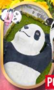
หมีแพนด้าเซลฟี