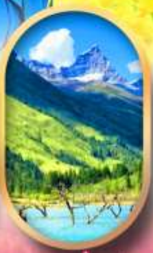
อุทยานสีครุณี