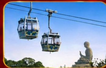
กระเชานองปิง