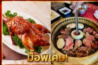
บ๊อฟเตซี่! เปิดอย่างอ่องกข บูฟเฟต์ปิงย่างเกาหลี