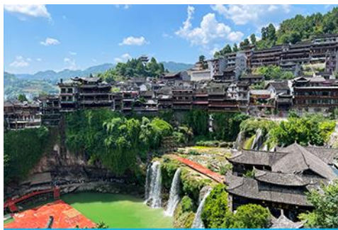
เมืองโบราณ ผู่หรงเจิ้น