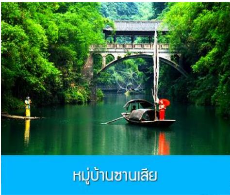
หมู่บ้านชาบเสีย