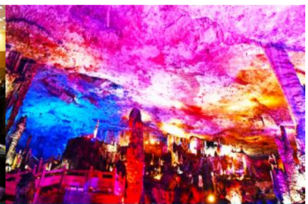
ถ้าเก้าสวรรค์จิวเทียนต้ง