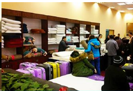
ศูนย์จำหน่ายผลิตภัณฑ์ยางพารา