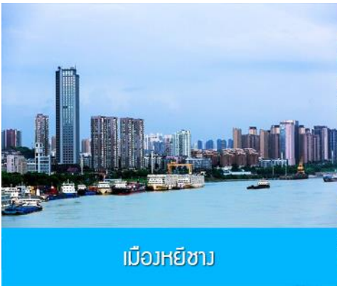
เมืองหยีซาง