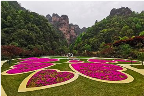
อุทยานฟงเลี่ยนซี