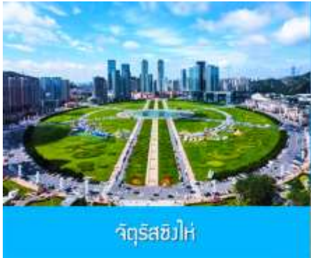
จัตุรัส星海

นำท่านเที่ยวชม ถนนญี่ปุ่น 日本风情街 เป็นอีกหนึ่งแหล่งช้อปปิ้งที่นักท่องเที่ยวไม่ควรพลาด ได้รับฉายาว่าเป็น เกียวโตน้อยแห่งราชวงศ์ถัง 盛唐小京都 ออกแบบโดยสถาปนิกชาวญี่ปุ่น และใช้วัสดุที่นำเข้ามาจากญี่ปุ่นในการก่อสร้าง ที่นี้ถูกเนรมิตให้กลายเป็น เมืองเกียวโตขนาดย่อม และเป็นจุดเช็คอิน ถ่ายภาพ สำหรับนักท่องเที่ยวสมัยใหม่..