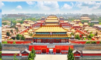
พระราชวังต้องห้ามกุ๊กง

*ทางบริษัทฯ ขอสงวนสิทธิ์ในการสลับโปรแกรมทัวร์ตามความเหมาะสมขึ้นอยู่กับสถานการณ์หน้างาน โดยคำนึงถึงผลประโยชน์ของลูกค้าเป็นสำคัญ