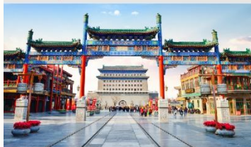
ถนนโบราณเฉียนเหมิน