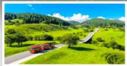
เหนางฟ้า

เดินทางโดย: สายการบินฉงชิ่งเจียงเป๋ย์ (PN)