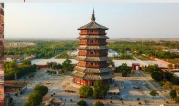
วัดเจดีย์ไม้ มู่ต้า

*ทางบริษัทฯ ขอสงวนสิทธิ์ในการสลับโปรแกรมทัวร์ตามความเหมาะสมขึ้นอยู่กับสถานการณ์หน้างาน โดยคำนึงถึงผลประโยชน์ของลูกค้าเป็นสำคัญ