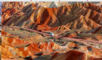
ภูเขาสายรุ้งจางเย่ต้นเสี่ย