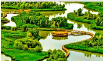
อุทยานพื้นที่ชุ่มน้ำจางเย่