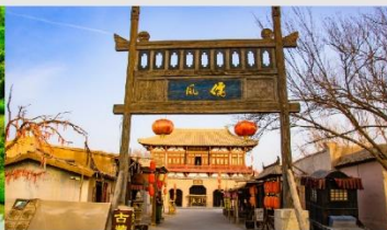
เมืองโบราณตุนหวง