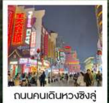
ถนนคนเดินหวงชิ่งลู่

ถนนคนเดินเต้าซือเหอเจีย • น้ำตกฟูหลง (รวมค่าเช่าถ่ายรูปกับวิวน้ำตกท่านละ 1 รูป) • ชมบรรยากาศยามค่ำคืนเมืองโบราณฟูหลงเจี้ยน ดวงตาแห่งเฟิ่งหวง • หอคอยประตูเมืองตะวันออก • Bar Street • เมืองโบราณเฟิ่งหวง • สะพานสายรุ้ง ล่องเรือตามลำน้ำถั่วเจียง ชมเมืองโบราณเฟิ่งหวงยามค่ำคืน • อำเภอเจียงโข่ว • เขาฟ่านจิ้งซาน (รวมกระเช้าขึ้น-ลง+รถอุทยาน) หงอวี่นจินตัง • เสาคินเห็ด • เมืองกงเหริน • จัตุรัสยาวขนเซี่ยงกงเสวีย • วัดโคฝู • ถนนหวงชิ่งลู่ • อีสะฮ้อปั้งเอ๋ากั๊กเก็กฉางซา