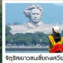
จัตุรัสยาวขนเซี่ยงกงเสวีย

จางเจียเจีย เฟิ่งหวง • ฟ่านจิ้งซาน • ฉางซา