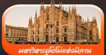
มหาวิหารดูโอโมแห่งมิลาน