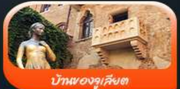
บ้านของจูเลียต

พิเศษ ขึ้นกระเช้าชมวิวดอกเขาโดโลไมท์ ALPE DI SIUSI