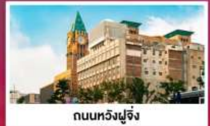
ถนนหวังฝูจิ่ง