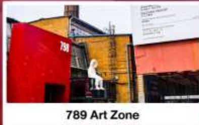
789 Art Zone