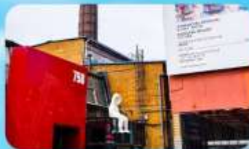
798 Art Zone