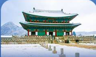
พระราชวังเคียงบก

สัมผัสเสน่ห์ทุกความเพลิดเพลินแบบจัดเต็มทีสกีรีสอร์ท พร้อมกิจกรรมสุดมันส์ถึงสกี สโนว์บอร์ด และสโนว์สไลด์ ก่อนสัมผัสไฮไลท์สุดว้าว ณ ทะเลสาบชั้นจอง ลานน้ำแข็งธรรมชาติ ขนาดใหญ่ที่เปิดให้สนุกกับการตกปลาแม่น้ำแข็ง บินจักรยานเปิด และลากเลื่อน เพียงปีละครั้งเท่านั้น พลาดไม่ได้กับการช้อปปิ้งจิวelryที่เมืองคังและฮงแด เกียวสนุก ช้อป ฟิน ครบทุกสไตล์สไตล์ในทริปเดียว