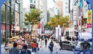
ช้อปบิงช่านเมียงดง