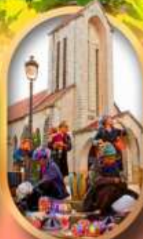
โบสถ์หินซาปา