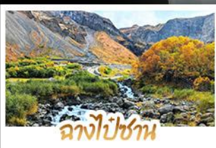
ฉางไป่ซาน