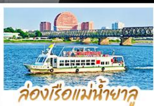
ล่องเรือแม่น้ำฮาลู