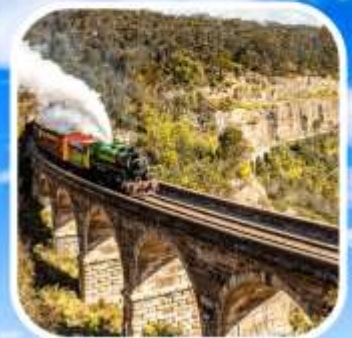
ZIG ZAG RAILWAY