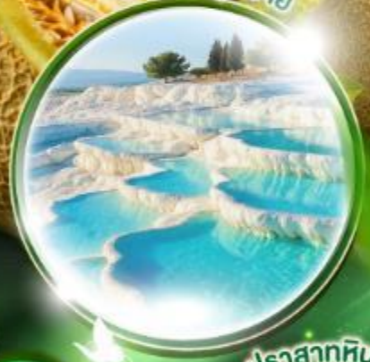
ปราสาทหินยิวซาร์