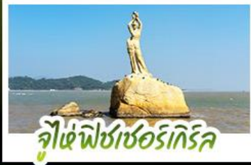
จุไห่พิชเชอร์เกิร์ล

ดื่มด่ำบรรยากาศสุดคลาสสิกสไตล์อังกฤษ ณ THE LONDONER MACAO ไหว้พระ-ตั้ง 3 วัดตั้ง ขอพรการทำงาน การเงิน ความรัก ครอบงมในทวีปเดียว ชมความวิจิตรตระการตาของพระ-ราชวังหยวนหมิงหยวนใหม่แห่งจุไห่ ช้อปปิ้งจุใจ ย่านจับชาจู้ยและถนนคนเดินฟู่หัวหลี่