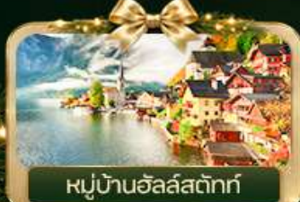
หมู่บ้านอัลส์ดัทท์