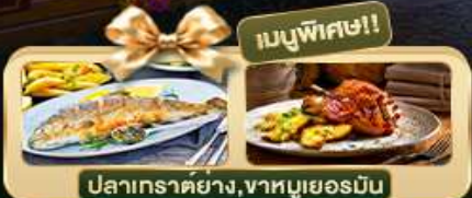
เมนูพิเศษ!! ปลาเทราต์ย่าง, ฆาตบุเยอร์มิน