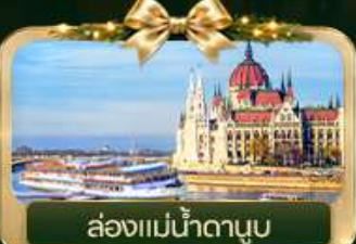
ส่องแม่น้ำดานูบ

Germany Austria Czech Slovenia Hungary Celebrate Christmas Market Zugspitze Munich Salzburg Hallstatt Bratislava