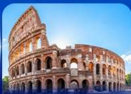
เช็กอินดัง โคโลสซียม โรม