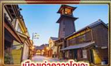
เมืองท่าคาวาโกเอะ

ฉลองเทศกาลปีใหม่ เล่นสกีท่ามกลางหิมะ "ฟูจิเท็น"