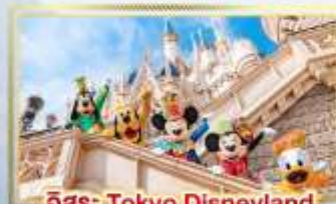
อีสะ: Tokyo Disneyland