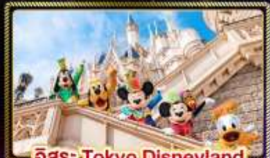
อิสระ Tokyo Disneyland