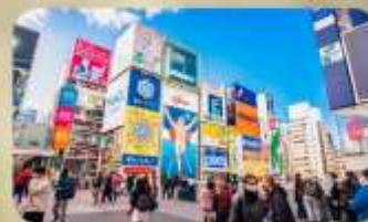
ซูปป์ิงชินโซบาชิ