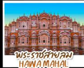
พระราชสาลม HAWA MAHAL