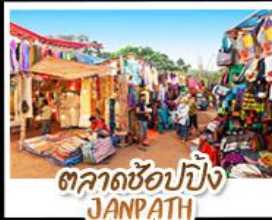
ตลาดช้อปปิ้ง JANPATH