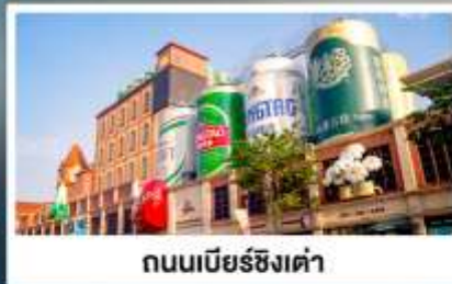
ถนนเบียร์ชิงเต่า