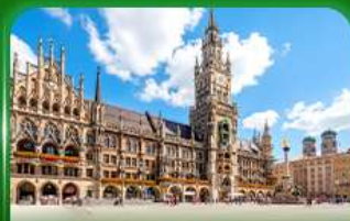
จัตุรัสมาเรียนพลัทซ์ มิวนิก