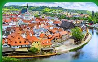
เมืองมรดกโลก เซสท์ครุมลอฟ