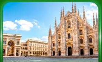
มหาวิหารดูโอโมแห่งมิลาน