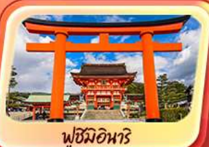
ฟูชิมิอินาริ

4 - 8 พ.ย. 69 / 11 - 15 พ.ย. 69 13 - 17 พ.ย. 69 / 20 - 24 พ.ย. 69 27 พ.ย. - 1 ธ.ค. 69 / 11 - 15 ธ.ค. 69