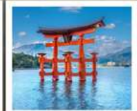
ศาลเจ้าอิตสึคุชิมะ