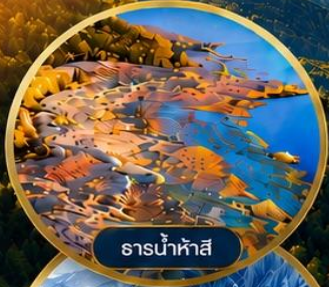
ธารน้ำห้ำสึ