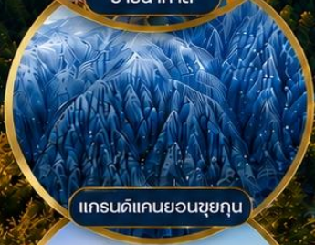
แกรนด์แคนยอนซูยกุน