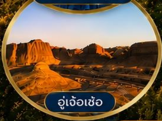
อู๋เจ้อเซ่อ