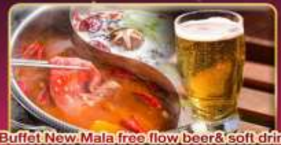
*Buffet New Mala free flow beer & soft drink