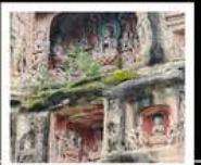
หินแกะสลักหนานคาน

PERIOD 1 : 13 - 17 ต.ค. 2569 | PERIOD 2 : 17 - 21 ต.ค. 2569