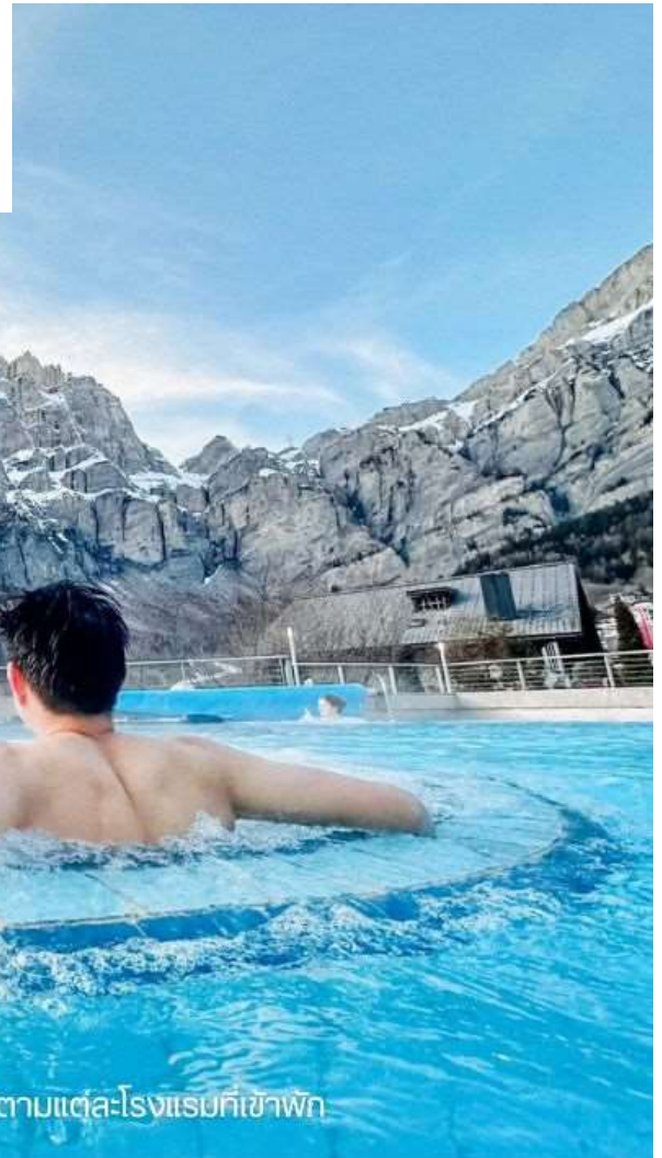
บรรยากาศของบ่อน้ำแร่ อาจจะไม่แตกต่างกันไปตามแต่ละโรงแรมที่เขาพัก

บรรยากาศบ่อน้ำแร่ เมืองลอมบาร์ด บรรยากาศจริงจะมีความแตกต่างไปในแต่ละฤดูกาลท่องเที่ยว