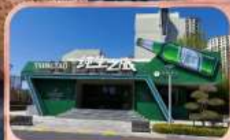
โรงงานเบียร์ซิ่งเต่า