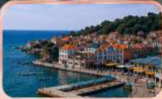
หมู่บ้านชาวประมงชาวจ้อไห่ว