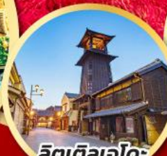
ลิตเติลเอโดะ เมืองควาโกเอะ