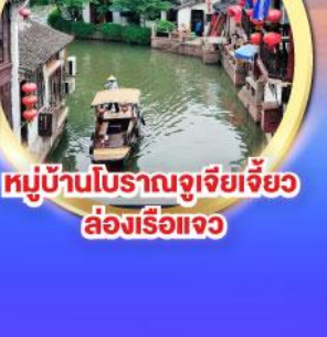
หมู่บ้านโบราณจูเจียเจี้ยว ล่องเรือแจว