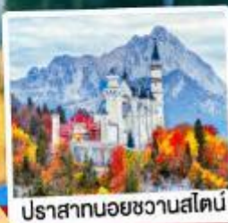
ปราสาทน้อยชวานสไตน์

09-15, 12-18 เม.ย. 69 26 เม.ย.-02 พ.ค. 69 29 เม.ย.-05 พ.ค. / 30 เม.ย.-06 พ.ค. 69 02-08 พ.ค. / 24-30 มี.ย. 69 02-08, 16-22 ก.ย. 69